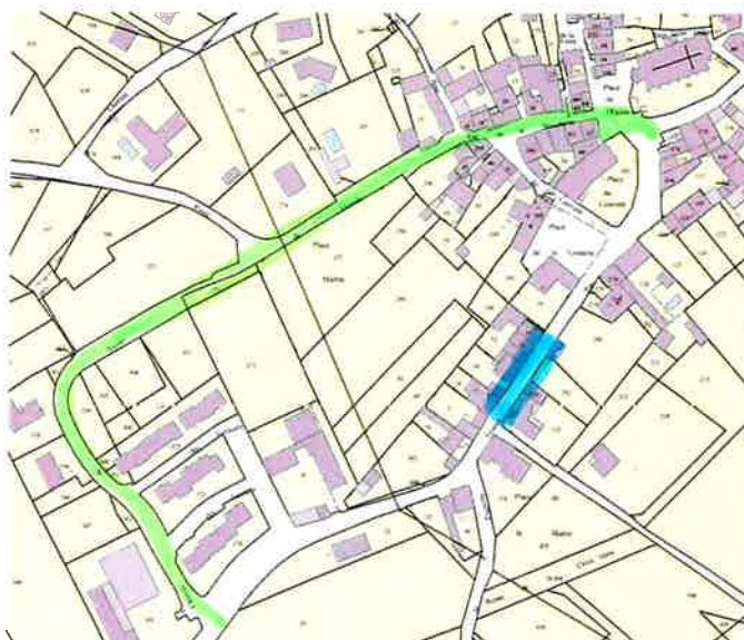
Déviation à prévoir (en vert)