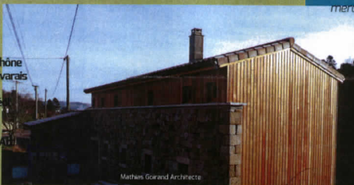
Mathias Gorand Architecte